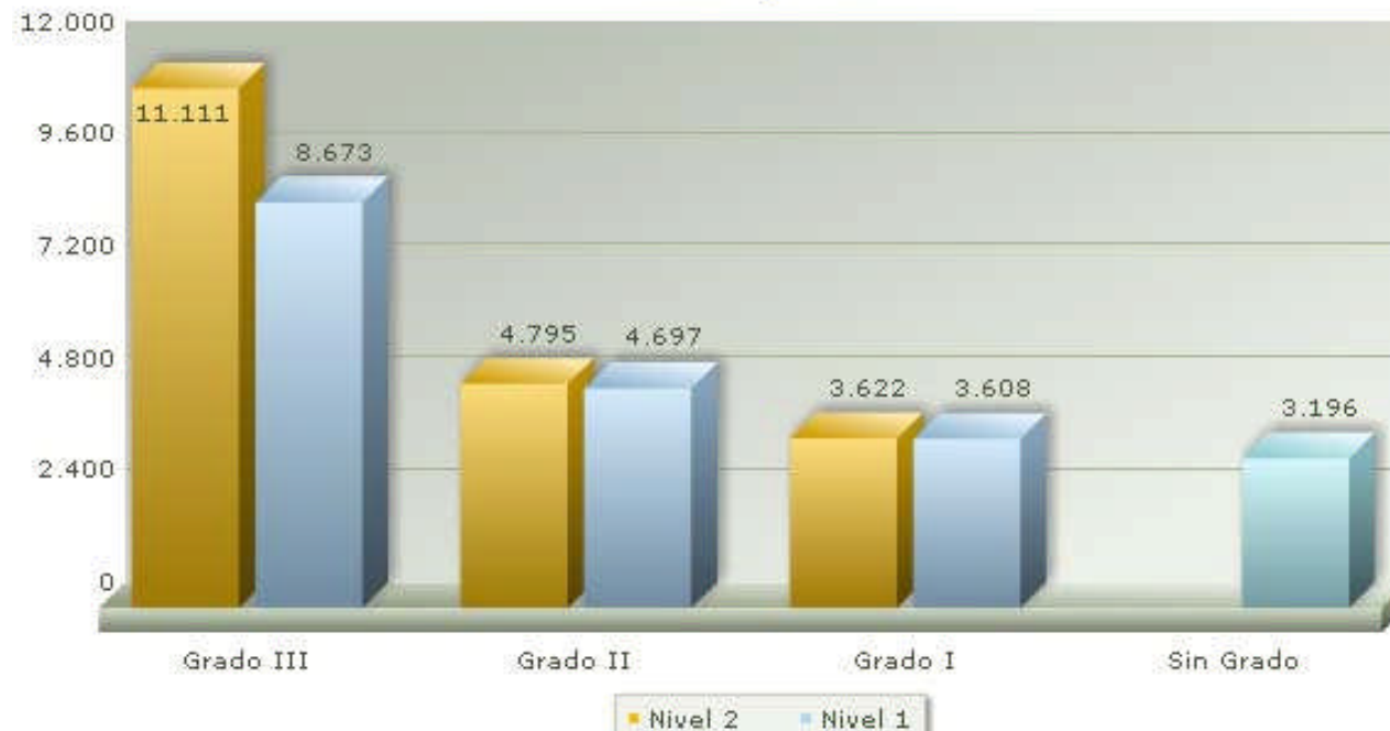
Grados y Niveles