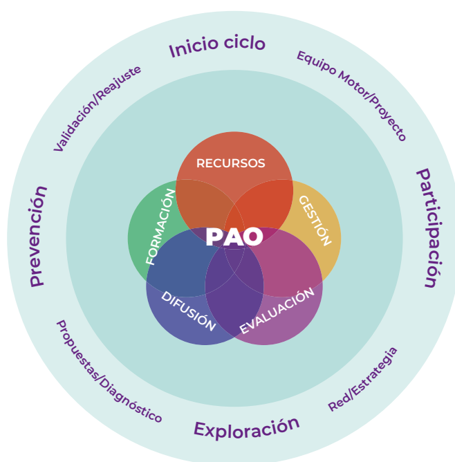
GRÁFICO 4: EL CICLO DE LAS SIETE ETAPAS DEL PROYECTO PAO

Para ello, es necesario tener en cuenta las entidades y organizaciones que conforman la comunidad, incluyendo sus sistemas de liderazgo y poder, los recursos existentes, ya sean públicos o privados (regulados y con responsabilidad social) como los servicios educativos, sanitarios, sociales, de trabajo y empleo, cultura, deporte, ocio y tiempo libre, y, por supuesto, conocer y activar los mecanismos de participación existentes en cada municipio.