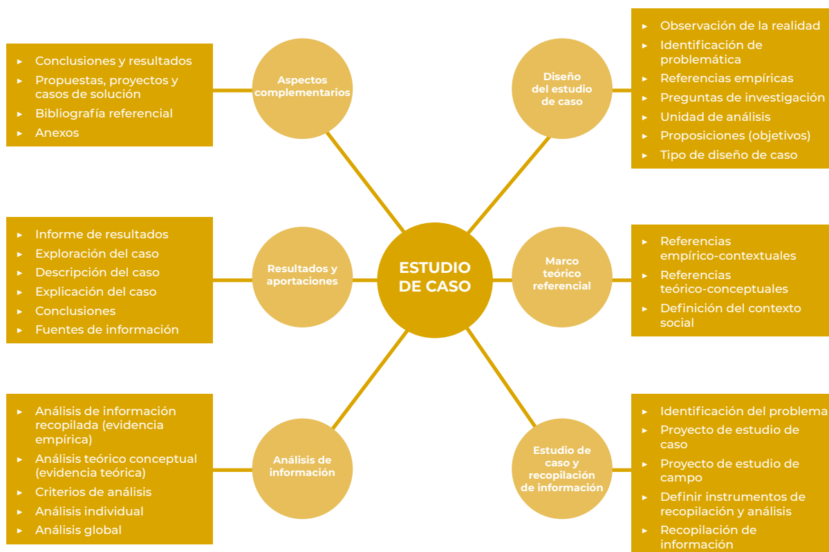
GRÁFICO 3. PLANIFICACIÓN DE UNA INVESTIGACIÓN BASADA EN UN ESTUDIO DE CASO PRÁCTICO