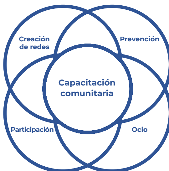
GRÁFICO 5. LA INTERRELACIÓN ENTRE LAS DISTINTAS ESFERAS DE FORMACIÓN

La formación prevista se desarrollará mediante la creación de talleres independientes, que permitan una fácil adaptación a las necesidades del equipo municipal o del EM liderando la implementación del proyecto, de acuerdo con las lagunas detectadas, así como la formación de otras organizaciones sociales o de la industria, cuya participación se considere relevante para su desarrollo.