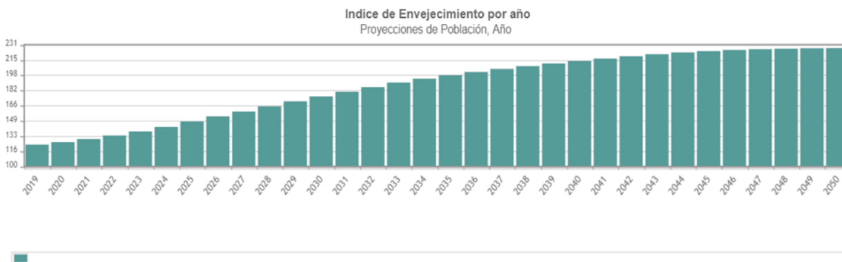
Ilustración 1. Gráfico obtenido del Instituto Nacional de Estadística (INE)

Índice de envejecimiento por comunidad autónoma en 2022, las comunidades más envejecidas son Asturias, Galicia y Castilla León (con índices de 240%, 213,53% y 211,41% respectivamente), mientras que los territorios con índices más bajos son las ciudades autónomas de Ceuta y Melilla, Murcia y Baleares, todas con datos inferiores al 110%. El siguiente gráfico elaborado a partir de las proyecciones de población, nos muestra cómo se prevé que este Índice de envejecimiento siga creciendo en los próximos años.