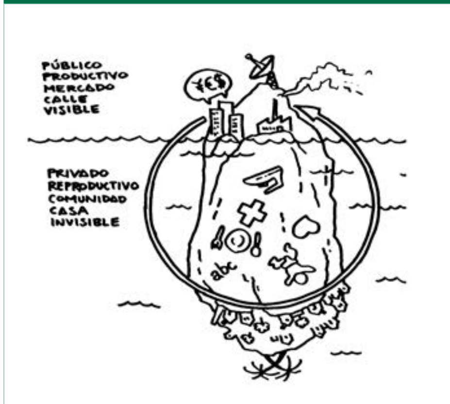
El iceberg de la economía (ColaBoraBora)

Esta concepción identifica la producción con aquella actividad que tiene lugar fuera del ámbito doméstico, en la esfera pública y, mayoritariamente, masculino. Por el contrario, el trabajo doméstico se realiza en la esfera privada, no es remunerado y es el ámbito de la actividad femenina por excelencia.