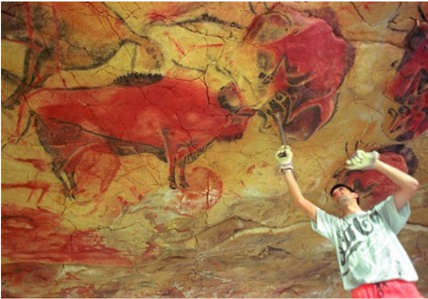
Foto de una persona que cuida las pinturas

¿Sabías que fue una niña la que descubrió las pinturas de Altamira?