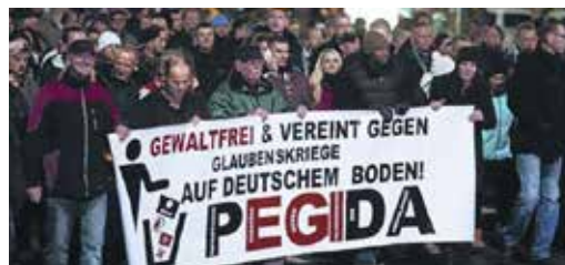
Manifestación de Patriotas Europeos contra la Islamización de Occidente (PEGIDA)

Las campañas xenófobas en Europa y el populismo ultranacionalista posibilitan resultados espectaculares en todos los países, en Suiza el Partido Popular alcanzaría el 29% del electorado, en Holanda, Wilders y su islamófobo Partido de la Libertad el 15,5%, en Hungría el Jobbik un 21% (relacionado con una fuerza para-