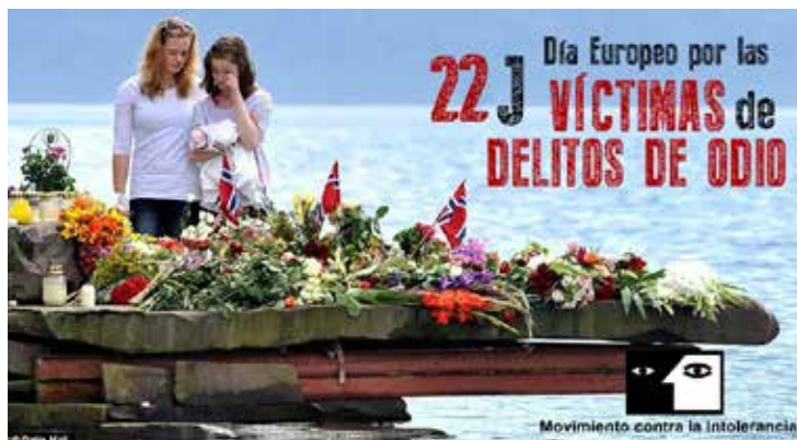
In Memoriam de las víctimas asesinadas en Utøya-Oslo