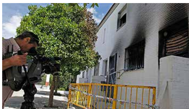
Un cámara grava el incendio que provocaron algunos vecinos de Estepa en una de las viviendas asaltadas

Tercero: Lo que sigue a continuación demuestra hasta que punto aquellos bárbaros no respetaron ni siquiera a la Guardia Civil. Sobre la una de la tarde, los imputados se trasladaron a otra calle de Estepa y, “a pesar de que la Guardia Civil en todo momento intentó que se calmaran y que desistieran de asaltar la casa, a pesar de que los insultaron y arrinconaron, los denunciados entraron también en el inmueble produciendo destrozos en muebles y enseres”. Pero, gracias a Dios, la familia gitana que la ocupaba, asustados y temiendo por sus vidas, salieron huyendo “porque saltaron al patio colindante”.